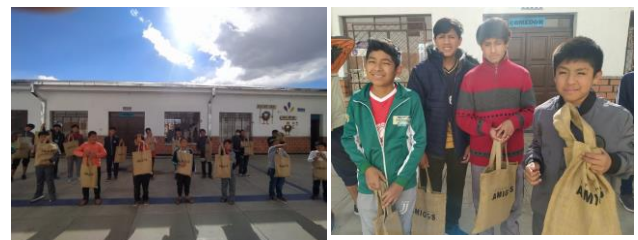
Blijde jongens bij Hogar Sucre

Veiling met een Missie Zoeterwoude bedankt voor jullie bijdrage, die voor een deel deze mooie actie heeft ondersteund. Ook danken we de mensen in Bolivia voor de voortreffelijke organisatie.