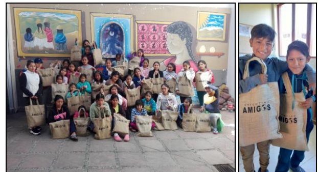
Amigostasje met schoolspullen Misky Wasi en Mallorca

Een Amigos-tasje met pennen, kleurpotloden, een schrift, liniaal, gum etc. is een grote hulp voor de kinderen. Het is een concrete steun en een mooie stimulans om de kinderen ook in deze moeilijke tijd te blijven motiveren om door te gaan met school.