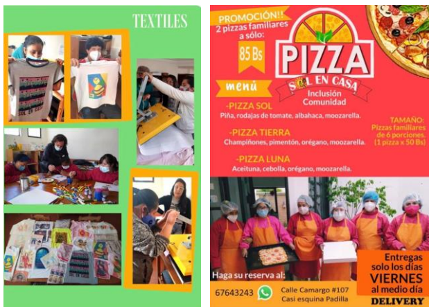
Het textiel- en pizza-project met trotse jongeren!

De jongeren hebben al een paar jaar een project waarbij ze pizza's maken en verkopen. De verkoop was altijd op straat bij de faculteit van economie. Door de corona is dit project omgezet in pizza-delivery. Het is belangrijk voor deze jongeren om projecten te doen waarbij ze ook geld kunnen genereren voor de families en het centrum en voor sociale inclusie. Voor de delivery helpen ook een aantal mama's mee die geen werk hebben. Voor dit project was een aparte koelkast nodig om alle ingrediënten voor op de pizza's goed te kunnen bewaren. Stichting Amigos heeft deze koelkast gedoneerd voor de vrijdag pizza-deliverydag.